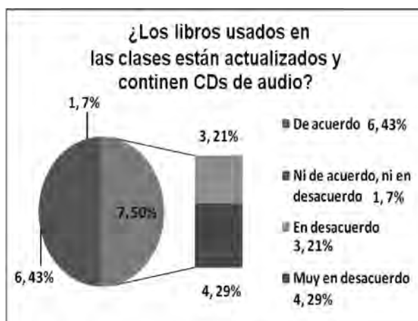
Figura No. 1. Porcentaje de estudiantes en desacuerdo con textos desactualizados

Por otra parte, el CNU (2008) expresa que se considera desactualizada la bibliografía propuesta en un programa de asignatura cuando esta tiene más de 10 años de haber sido publicada.