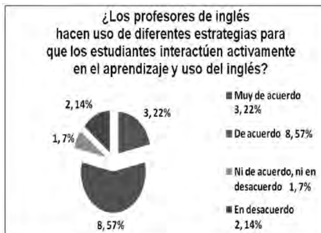
Figura No. 5. Estrategias en el aprendizaje del inglés.

No obstante, una de las autoridades de la URACCAN, especialista en la enseñanza del idioma inglés, resalta que el interés y motivación que muestre el estudiante como tal juega un papel determinante, es decir, que los estudiantes deben de contribuir de forma significativa en su propio aprendizaje y aprovechar cada espacio que se le brinda para practicar y usar la lengua que aprende. Agrega que para la URACCAN es importante que sus estudiantes se gradúen hablando una segunda lengua, ya que de esta manera tendrán más y mejores oportunidades laborales (Entrevista, 10-01-2010).