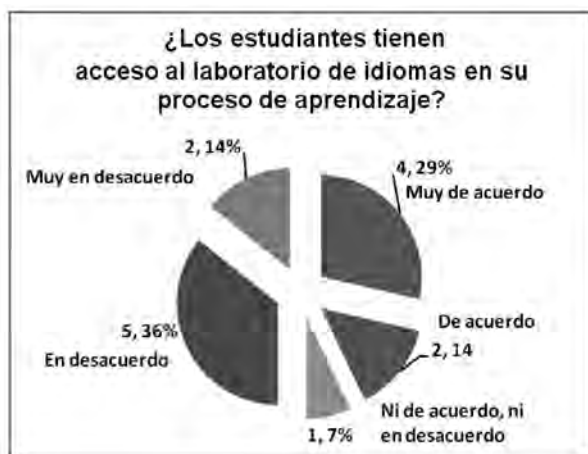
Figura No. 3. Laboratorio para el aprendizaje del inglés.

El 50% del estudiantado concuerda con Cárdenas (2002), al confirmar que la función del laboratorio de idiomas, bien acondicionado, es indispensable durante el aprendizaje del inglés en la carrera de Administración de Empresas. No obstante, manifiestan no tener acceso a este medio en su aprendizaje. La figura muestra además que un 43% expresaron que hacen uso del laboratorio de idiomas, esto se explica porque los docentes aprovechan algunos espacios libres para hacer uso del laboratorio de informática para conducir ciertas lecciones, pero esto no es constante.