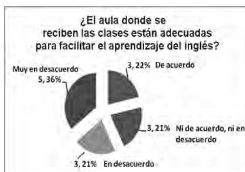
Figura No. 2. Aulas habilitadas para el aprendizaje.

La figura No. 2 muestra que un número significativo de los discentes concuerda que el aula de clases sólo ofrece las condiciones básicas (pizarra, pupitres, energía eléctrica, iluminación, silla y mesa para el docente y el espacio mismo del aula). Reconocen que la URACCAN ha hecho muchos esfuerzos para ofrecer las mejores condiciones. No obstante, consideran que las aulas no están ambientadas para facilitar el proceso de aprendizaje del inglés.